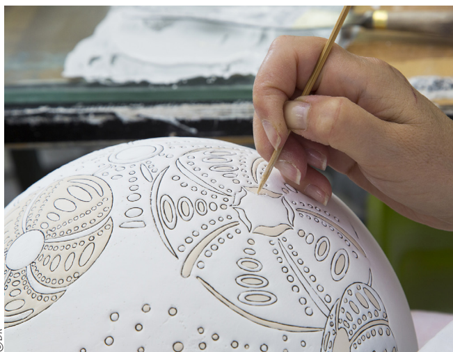
Emaux de Longwy