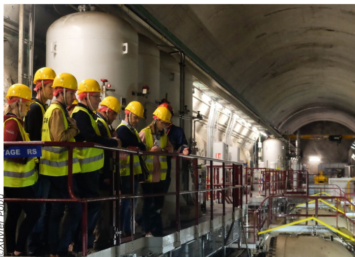
EDF - Centrale de Kembs

*Sur la base des données 2022. Merci de citer Entreprise et Découverte pour toute exploitation de ces données.