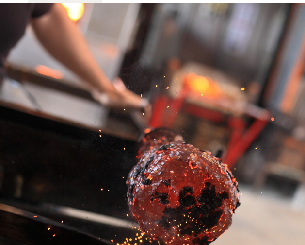
Site Verrier de Meseinthal

En 2022, l'Agence Régionale du Tourisme Grand Est s'engage avec Entreprise et Découverte pour la réalisation d'un diagnostic de la Visite d'entreprise. 55 entreprises pépites sont identifiées (entreprises d'excellence présentant un potentiel pour la visite d'entreprise). La même année, la région est lauréate d'un Appel à Manifestation d'Intérêt sur le tourisme de savoir-faire lancé par la DGE (Bercy). Une vingtaine d'entreprises seront aidées par l'État et la Région pour développer une nouvelle offre de Tourisme de savoir-faire.