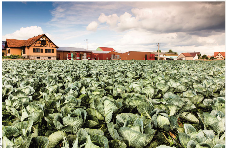
Maison de la choucroute Le Pic